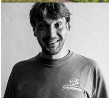
Azienda Agricola Giovannini - www.vinigiiovannini.it/